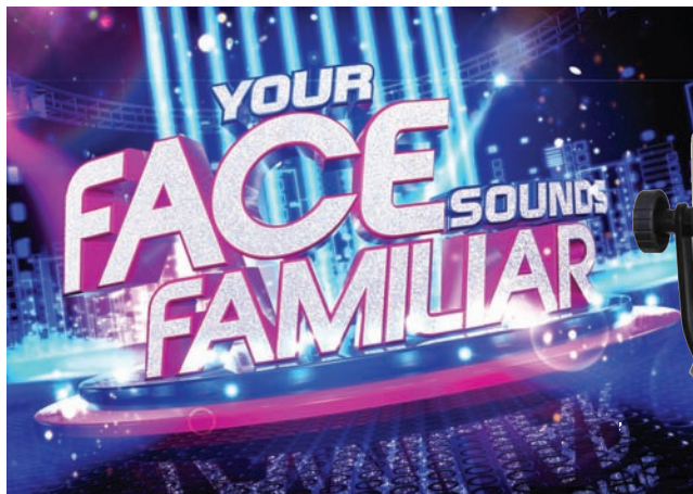
Заставка шоу «Твое лицо звучит знакомо»

Двухцветная светодиодная система ANOVA Bi-Colour способна точно создавать белый свет с цветовой температурой, характерной для свечи, и до полноценного дневного, с шагом 10K. А для удобства значение цветовой температуры отображается на дисплее в режиме реального времени.