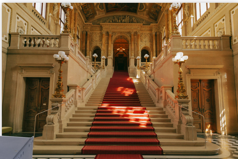
Фасад и главная лестница Burgtheater