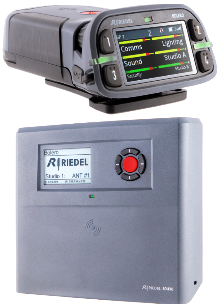
Приемопередатчик и антенна Bolero

Системный консультант Riedel Communications Кристоф Граф добавил: «Внушительное и величественное историческое здание – это очень сложная среда для установки беспроводной системы, но мы смогли обеспечить охват всего здания без исключения с помощью 36 антенн. Связь есть везде, включая мастерские, ложи, столовую и студийную сцену. В этой работе большую поддержку нам оказали и сотрудники Burgtheater».