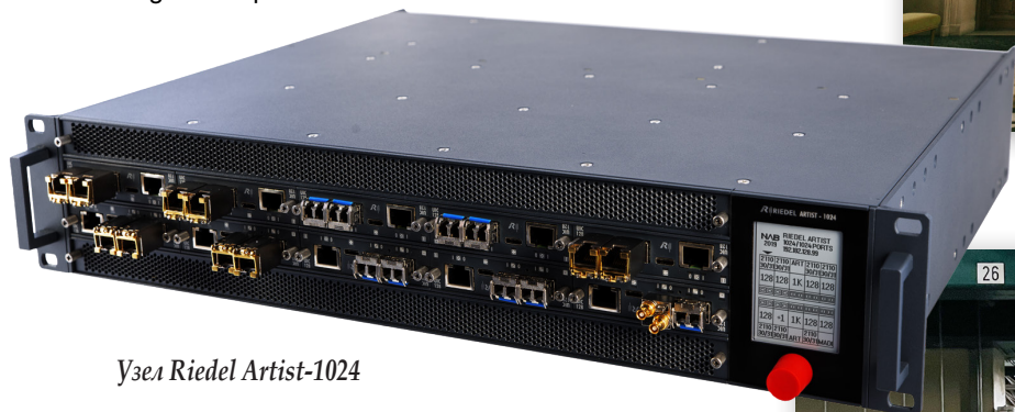
Узел Riedel Artist-1024

Сам этот театр считается одной из важнейших сцен в Европе, это второй по возрасту и крупнейший театр с постановками на немецком языке. Зал театра вмещает около 1340 зрителей, что делает Burgtheater одним из самых больших театральных площадок в Европе.