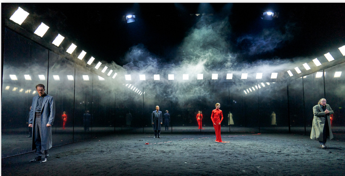
Спектакль «Мария Стюарт» на сцене Burgtheater

«При организации больших выездных представлений мы используем систему, содержащую почти 50 приемопередатчиков, как это делается для нашего легендарного спектакля «Мария Стюарт», когда мы даем его на сцене Kammerspiele в Гамбурге. Благодаря возможности буквально за считанные секунды загружать предварительно заданные конфигурации системы нам не нужно каждый раз адаптировать ее с нуля к особенностям той или иной площадки, что экономит нам много времени, – отмечает Майзль. – Сотрудничество с Riedel и очень тесное взаимодействие с Кристофом Графом было и остается очень ценным для всего Burgtheater, особенно с тех пор, как коллектив Riedel получил дистанционный доступ к нашей системе и может оказывать нам поддержку немедленно, как только возникают какие-то проблемы, либо если нужно внести те или иные изменения в настройки. Мы чувствуем, что находимся в хороших руках и не сомневаемся в надежности системы».