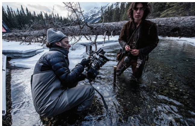
Оператор Эммануил Любецки на съемочной площадке. За работу над «Выжившим» он номинирован на «Оскар»