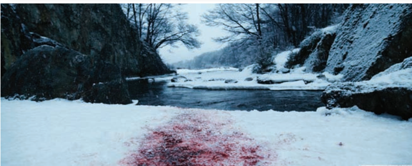
Кадр из фильма до (вверху) и после обработки