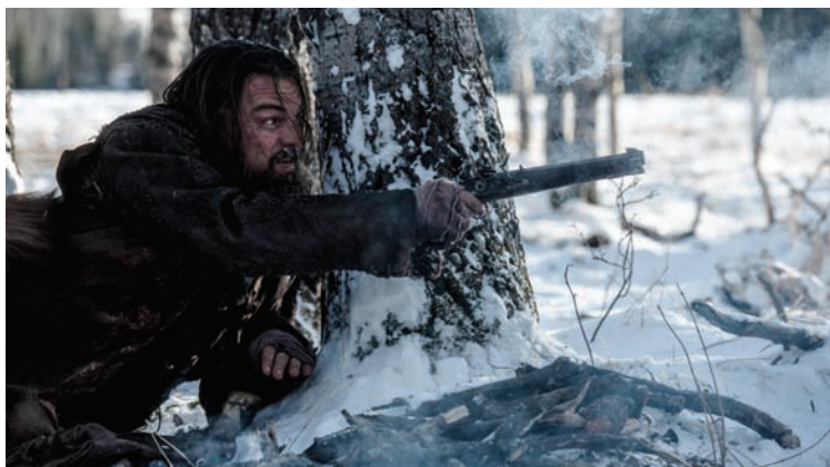
В кадре Леонардо Ди Каприо

Съемочный день был распisan следующим образом. В первой половине дня шли репетиции, во второй – съемки. Особое значение придавалось работе перед закатом, так называемому магическому часу (режимной съемке). Любецки удалось снять почти весь фильм при естественном освещении, за исключением ночной сцены у костра. Этот эпизод из-за ветра, гасившего огонь, снимали с использованием осветительных приборов.