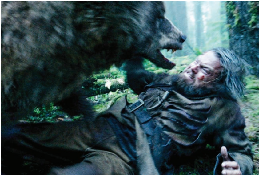
Анимированный медведь рвет на части героя Ди Каприо

из-за его отсутствия вследствие аномально теплой зимы. Наконец, они отвечали за создание единых продолжительных планов. Каким бы гениальным ни был оператор, снять продолжительную атаку индейцев на лагерь единым дублем вряд ли возможно. Эффект единого кадра создавался средствами композитинга, который позволял тщательно замаскировать склейки. При необходимости художники даже перестраивали задний план и насаждали компьютерные деревья.