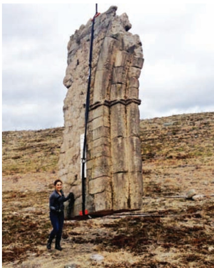
Фрагмент декорации церкви

ций, включая гору из черепов бизонов и руины европейского храма. Церковь создавалась в романском стиле под сильным впечатлением от картины «Андрей Рублев». Декорацию собирали на месте из блоков пенополистирола и усиливали металлическими профилями, чтобы она не грохнулась от ветра. Стиль фресок апеллирует к древнерусской живописи и перемешан с сюжетами эпохи конкисты.