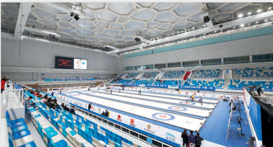
Соревнования по керлингу – для их трансляции применялась виртуализированная ПТС

Еще до начала Олимпиады в Токио OBS начала разработку собственной технологии, получившей название Automatic Media Description (AMD). Это технология автоматизированного описания медиаданных. Она становится все более зрелой и вскоре может начаться ее применение на практике. Систему обучают автоматически выполнять поиск конкретных последовательностей контента,