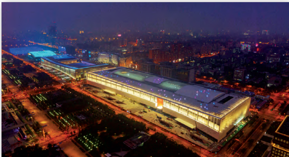
Международный вещательный центр в Пекине

Полное покрытие сетью 5G всех олимпийских объектов также обеспечило дополнительные возможности для прямых включений. И OBS, снова