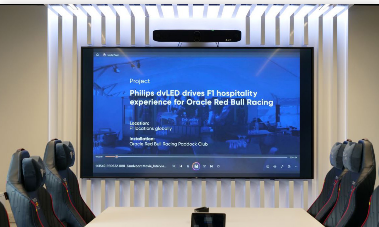
Дисплей Philips C-Line в переговорной комнате

Высококачественные и функциональные, дисплеи Philips Collaboration C-Line позволили существенно повысить эффективность работы группы маркетинга Oracle Red Bull Racing, поскольку обеспечили трансформацию каждого рабочего пространства в нечто более удобное