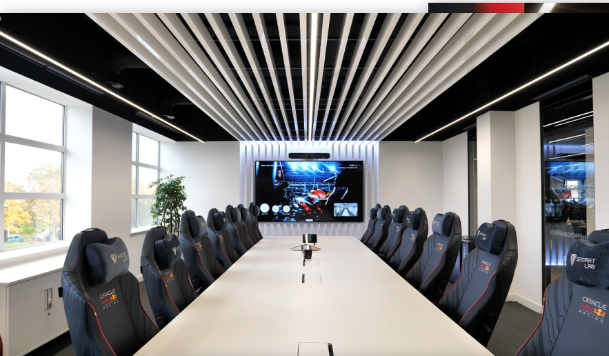
Офис руководителя группы маркетинга, оснащенный дисплеем Philips C-Line