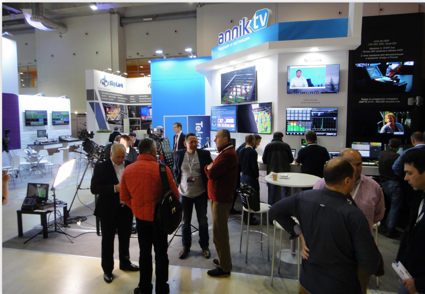
Стенд «Анник-ТВ» на выставке NATEXPO 2018

кинообъективов для ряда киностудий страны. Была организована база для их ремонта и сервисного обслуживания. В 1993 году «Анник» стал дистрибьютором еще одной знаковой для отрасли компании – немецкой Sachtler, после чего последовала реализация первого проекта по комплексному оснащению осветительным оборудованием большой телестудии площадью 300 м 2 для телерадиокомпании «Башкортостан», где в качестве базового было выбрано оборудование Sachtler.