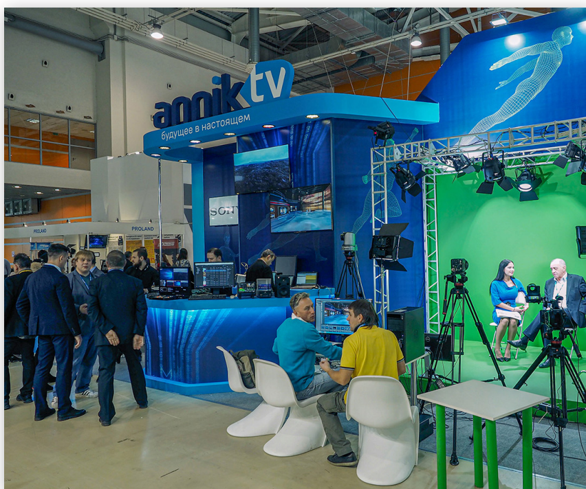
Стенд «Анник-ТВ» на одной из отраслевых выставок