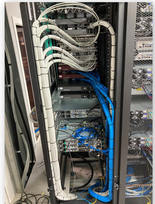
Центральная аппаратная «Кубань-ТВ» – один из свежих успешных проектов «Анник-ТВ»