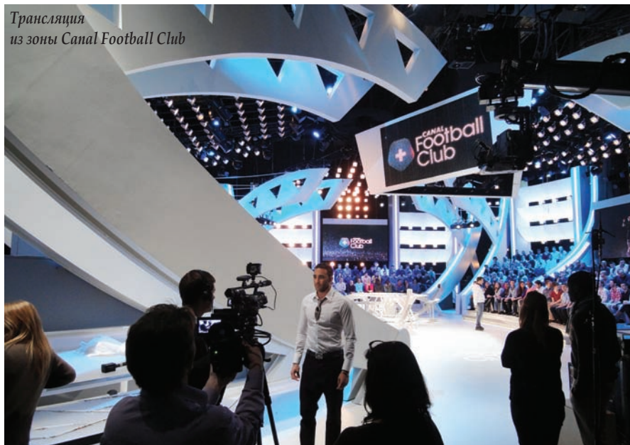
Трансляция из зоны Canal Football Club