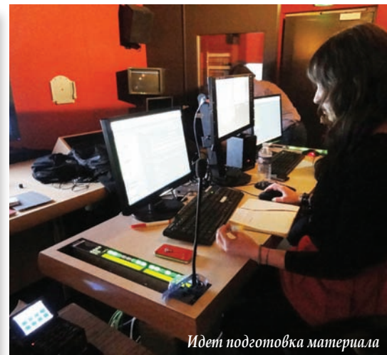
Идет подготовка материала