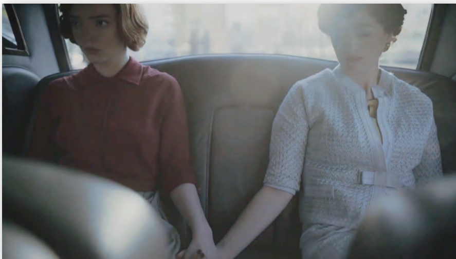
Любимый кадр оператора-постановщика