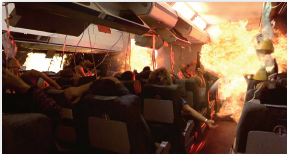
Сцена в самолете

«Пункт назначения» неожиданно стал кинохитом и породил несколько продолжений, а в настоящий момент киностудия New Line Cinema всерьез рассматривает возможность переснять киносерию. ▶