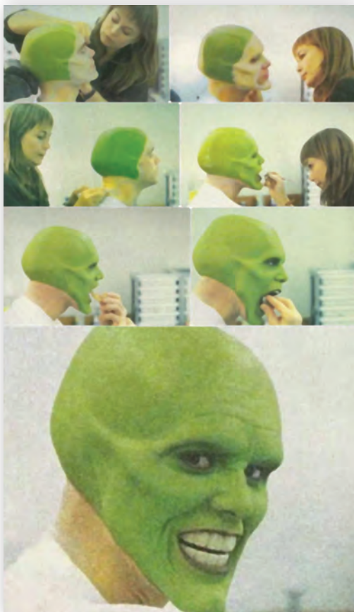
Компьютерная анимация и создание пластического грима для фильма «Маска»

числе за визуальные эффекты к картине «Терминатор 2: судный день».