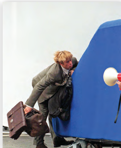
Съемка сцены с использованием фона и синего фургона