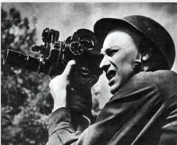
Кинооператор Роман Кармен

Картина демонстрировалась в 28 странах. Только в Америке и Англии его посмотрели более 16 млн зрителей. Примечательна ремарка Сталина о фильме: «Один хороший фильм стоит нескольких дивизий». Лента была от-