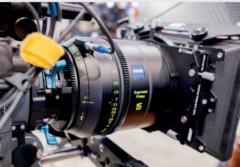
Новый 15-мм объектив Supreme Prime

Впервые демонстрировалось программное обеспечение для создания визуальных эффектов, открывающее, по мнению представителей компании, дверь в полностью новую технологическую экосистему. Демонстрация экспонатов на стенде сопровождалась серией импровизированных семинаров, куда в качестве выступающих привлекали не только представителей Zeiss, но и опытных операторов-постановщиков.