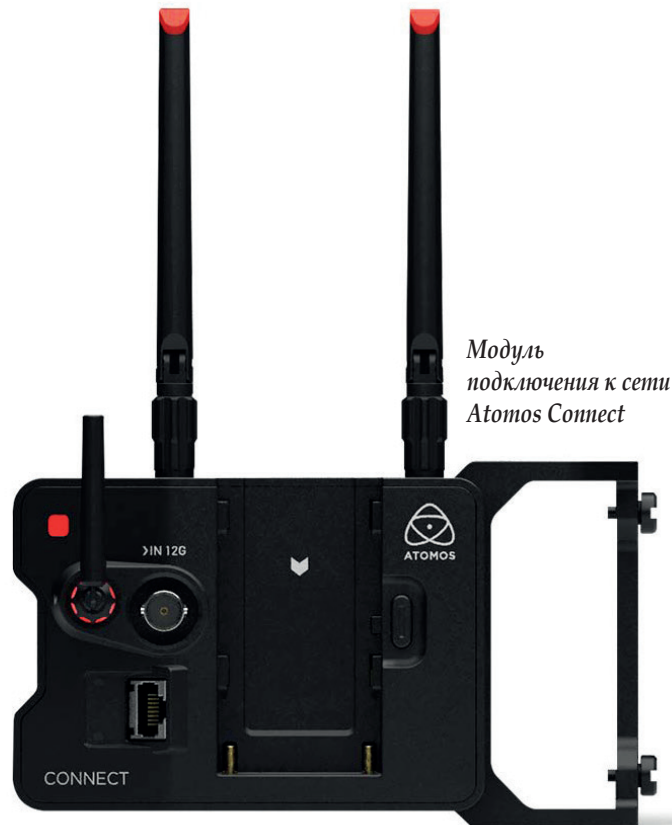
Модуль подключения к сети Atomos Connect

Что касается компании Atomos ( www.atomos.com ), то она представила ряд подключаемых к сети устройств с поддержкой рабочего процесса Frame.io Camera to Cloud, то есть облачного. Первое из устройств – это Atomos Connect, специально созданное для работы в связке с мониторами-рекордерами Atomos Ninja V и Ninja V+.