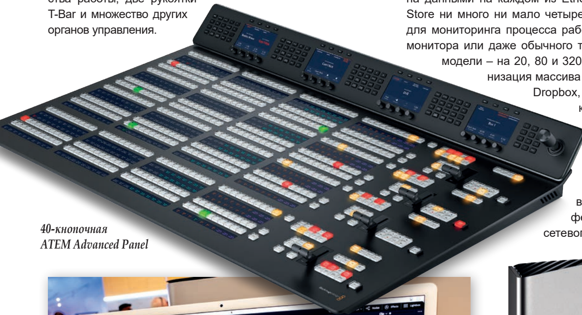
40-кнопочная ATEM Advanced Panel

Довольно много новостей было у компании Blackmagic Design ( www.blackmagicdesign.com ). Во-первых, анонсированы две новые модели микшерных консолей ATEM Advanced Panel с двумя линейками микширования/эффектов – 30- и 40-кнопочная. Эти консоли обладают достаточным набором органов управления для работы с самыми большими микшерами ATEM, но при этом компактны настолько, чтобы помещаться в пространство практически любой аппаратной. Обладая теми же функциями, что и 20-кнопочная, новые консоли шире, и это естественно. Каждая из моделей имеет несколько ЖК-дисплеев для удобства работы, две рукоятки T-Bar и множество других органов управления.