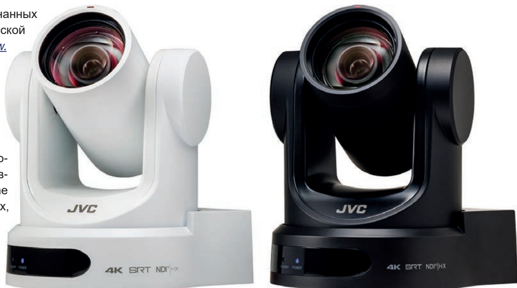
PTZ-камеры KY-PZ400N разрешения 4K

Акцент JVC был сделан на решениях для дистанционных трансляций, в том числе на системах CONNECTED CAM. Хотя многое из того, что демонстрировалось, фактически новинкой уже не являлось, но именно живьем было представлено впервые. Это касается, например,