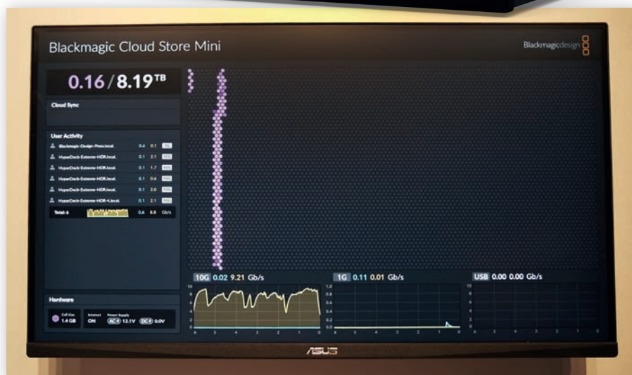
Миниатюрное сетевое хранилище Blackmagic Cloud Store Mini и мониторинг его состояния

В семействе рекордеров появились две новые модели – HyperDeck Extreme 4K HDR и HyperDeck Shuttle HD. Первая из них – это дека вещательного класса с 4K-записью в формате H.265. Она оснащена пользовательским интерфейсом на базе сенсорного экрана, на который, помимо HDR-изображения, выводится и разнообразная служебная информация, в том числе контрольно-измерительная. Из функций нужно отметить опцию в виде встроенного буфера памяти и применение таблиц 3D LUT. Есть ряд других, унаследованных от предыдущих моделей. Аппарат хорошо себя чувствует в вещательных комплексах, в составе видеоинформационных систем, может применяться для архивирования. Есть порт 10 Gigabit Ethernet для быстрой дистанционной выгрузки медиафайлов по сети.