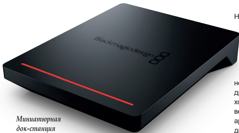
Миниатюрная док-станция Blackmagic Cloud Pod

личии порт 10G Ethernet, два порта USB-C для подключения внешних дисков, аппаратное ускорение для повышения эффективности работы, выход HDMI для мониторинга состояния и программные утилиты для MacOS и Windows. Никакие подписки и лицензии для использования устройства не требуются.