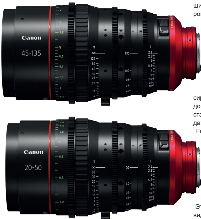
Объективы серии Flex Zoom

стояния, что не только помогает получить качественное изображение в светах и тенях, но и избавляет от необходимости корректировать освещение при укрупнении плана или уходе на общий план.