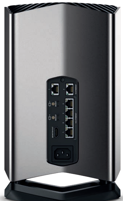
Система хранения Blackmagic Cloud Store – вид со стороны панели интерфейсов

Четвертая новинка – это устройство Blackmagic Cloud Pod, позволяющее использовать любой диск с интерфейсом USB-C в качестве сетевого хранилища. Здесь в на-