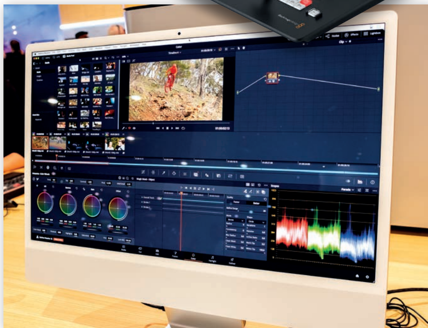
Графический интерфейс DaVinci Resolve 18

Во-вторых, выпущена бета-версия DaVinci Resolve 18. Она уже заточена на взаимодействие пользователей через облако, то есть позволяет нескольким монтажерам, колористам, специалистам по эффектам и обработке звука одновременно работать над одним и тем же проектом, на одной и той же временной шкале, находясь в разных точках мира. DaVinci Resolve 18 поддерживает платформу Blackmagic Cloud, а также новый рабочий процесс DaVinci Proху.