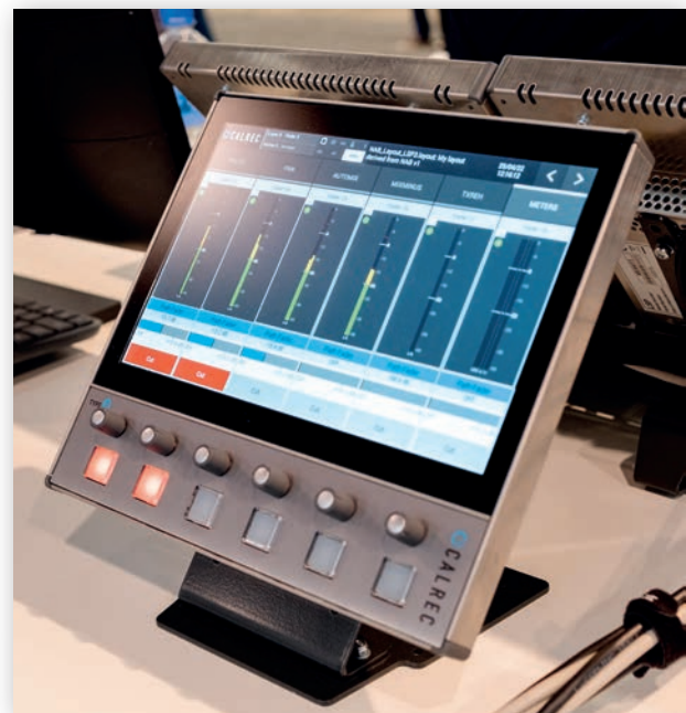
Консоль Talent Panel

Что касается консоли Type R, то она получила дополнения в виде компактной консоли Talent Panel. Это удобное и функциональное устройство позволяет гостям переключаться между несколькими источниками, используя сенсорный экран, и регулировать уровень звука в наушниках. Устройство можно адаптировать к предпочтениям конкретных пользователей. Talent Panel действует как оконечный элемент AoIP, ее легко настраивать и подключать к ней разные устройства.