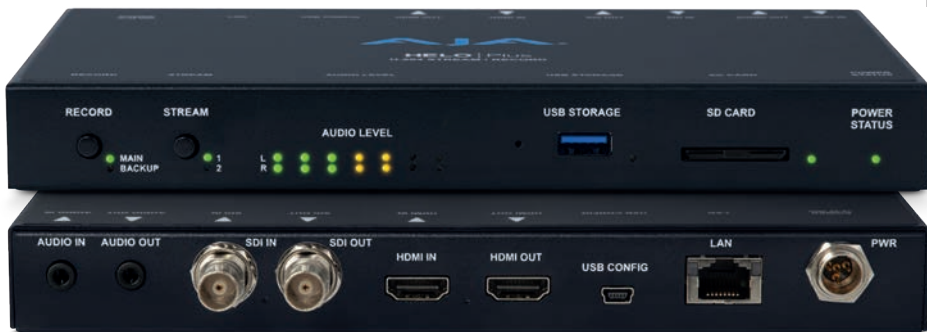
Устройство стриминга и записи HELO Plus

И, наконец, вышла версия 2.0 приложения Discover Media Edition, предназначенного для управления данными. Новая версия упрощает поиск, обнаружение и анализ медиаактивов вместе с ассоциированными метаданными. Все это возможно в локальном, дистанционном и облачном хранилищах. Также обновление содержит программный модуль для дистанционного медиаплеера Telestream GLIM и платформы обработки медиаданных Telestream Vantage.