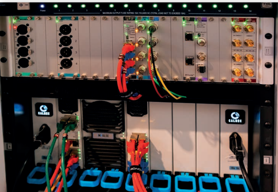
Стійка с процесорами ImPulse

состоит из 576 светодиодов, организованных в массив, а фокусировка на кадр киноплёнки выполняется с помощью нового цилиндрического элемента. В итоге площадь излучения света увеличена более чем вдвое, благодаря чему повышена скорость HDR-сканирования. Появился и ряд других возможностей.