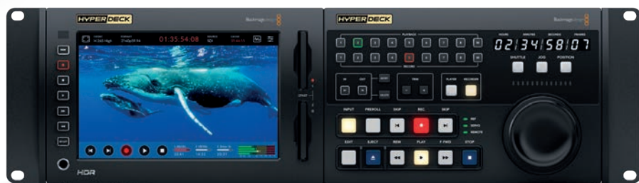
Новые рекордеры HyperDeck – Extreme 4K HDR (с блоком управления) и Shuttle HD

В семействе рекордеров появились две новые модели – HyperDeck Extreme 4K HDR и HyperDeck Shuttle HD. Первая из них – это дека вещательного класса с 4K-записью в формате H.265. Она оснащена пользовательским интерфейсом на базе сенсорного экрана, на который, помимо HDR-изображения, выводится и разнообразная служебная информация, в том числе контрольно-измерительная. Из функций нужно отметить опцию в виде встроенного буфера памяти и применение таблиц 3D LUT. Есть ряд других, унаследованных от предыдущих моделей. Аппарат хорошо себя чувствует в вещательных комплексах, в составе видеоинформационных систем, может применяться для архивирования. Есть порт 10 Gigabit Ethernet для быстрой дистанционной выгрузки медиафайлов по сети.