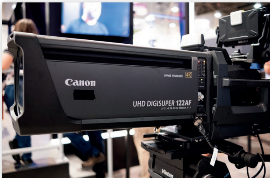
Новый флагман внестудийной оптики Canon – UHD-DIGISUPER 122 AF

Завершая рассказ о новинках Canon, нельзя не сказать и о новой прошивке для камер EOS C300 Mark III и EOS C500 Mark II. Она делает эти камеры совместимыми с рабочим процессом Frame.io Camera to Cloud. Разумеется, для взаимодействия с облаками потребуется стриминговый кодер, подключаемый к выходу камеры.