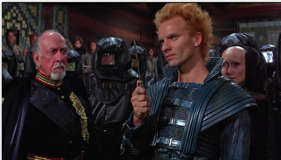
Кадр из фильма «Дюна» режиссера Дэвида Линча