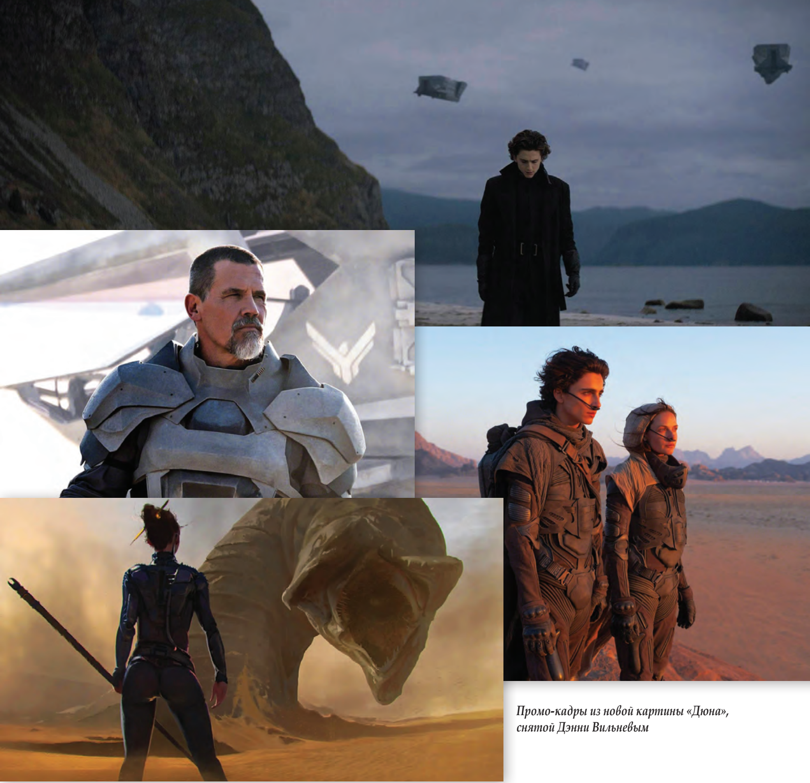
Промо-кадры из новой картины «Дюна», снятой Дэни Вильневым