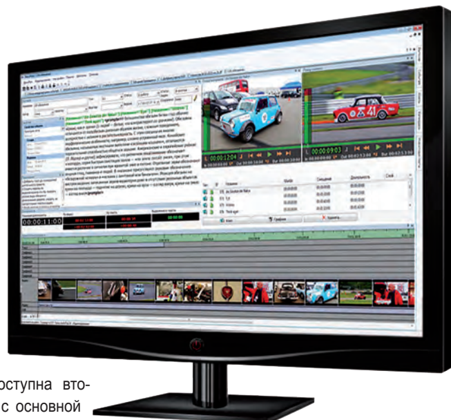
Обновленный модуль NewsPlan системы NewsHouse

Благодаря возможностям системы SerialCam и новой функции параллельной записи теперь можно моментально отдать на монтаж оцифрованный материал, записанный на съемные носители, что позволяет быстрее начать монтаж финальной программы. Это важно, например, при работе на выезде (ПТС, мобильные АСБ).