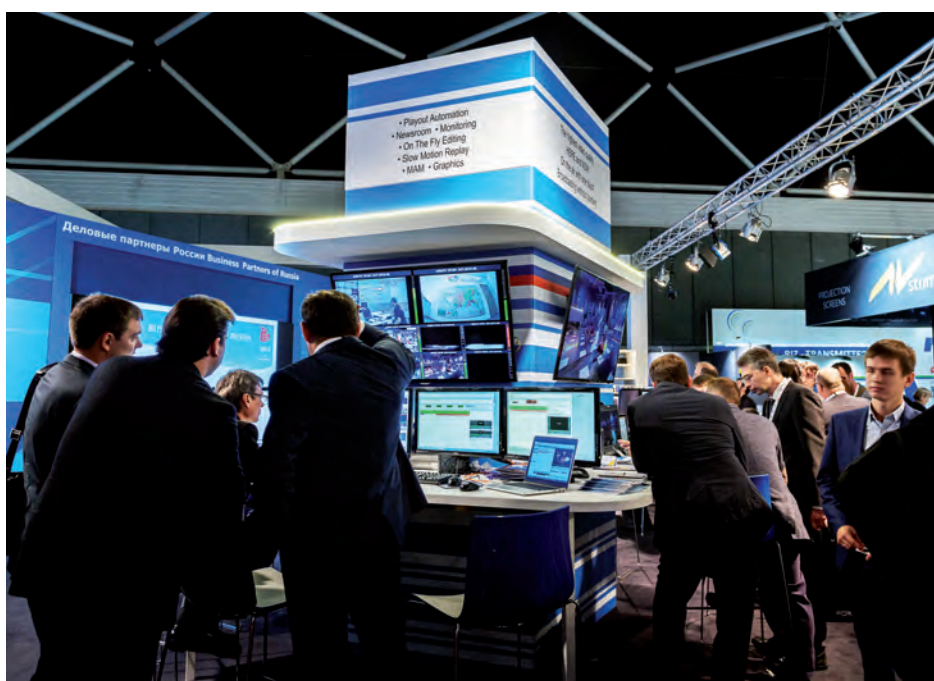
Экспозиция компании BRAM Technologies

Один из ключевых компонентов AutoPlay – интегрированная система подготовки и выпуска новостей NewsHouse, тоже была представлена на IBC. NewsHouse позволяет организовать весь технологический процесс новостного производства – от планирования выпусков до выхода в эфир с ручным/автоматическим управлением видеосервером, суфлером, генератором титров. Система дополнена обновленным модулем нелинейного мон-