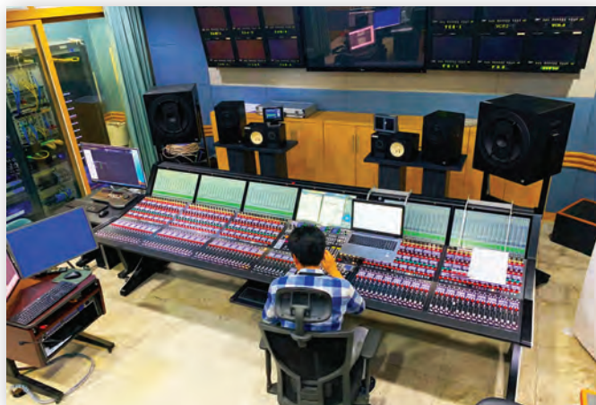
Микшер mc 2 96 Grand Production Console в аппаратной ACK-15 телекомпании KBS

«Творческий и технический персонал KBS TV был приятно удивлен, – отметил Сео. – Dong Yang Digital и Lawo объединили усилия с KBS в достижении желаемого результата: успешного выполнения проекта, завершенного вовремя и обеспечившего создание комплекса, готового к работе на крупных прямых трансляциях».