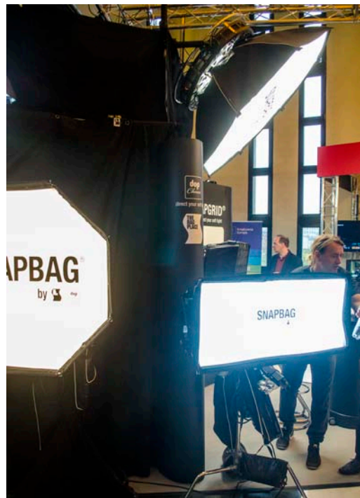
Софтбоксы и решетки DoP Choice

На стенде Canon была практически полностью представлена линейка оборудования Cinema EOS, включая камеры C300 и C500, XC10, новейшую