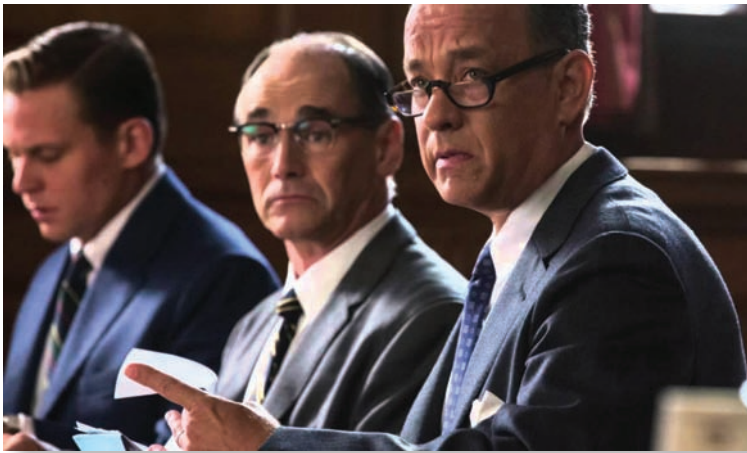
Кадр из фильма «Шпионский мост»