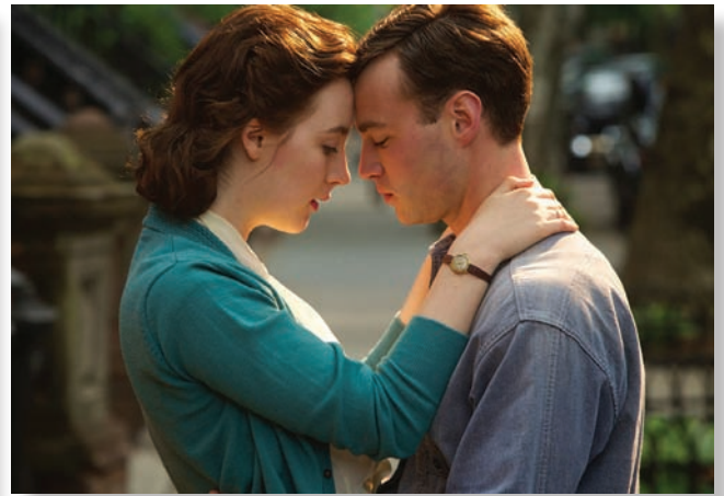
Кадр из картины «Бруклин»

рым слегка за 20, даже и не слышали аудиозаписей, воспроизводимых с магнитной ленты или виниловых пластинок, не говоря уж об эбонитовых. Весь их звуковой мир ограничен форматами CDA и MP3.