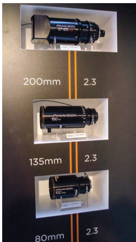
Анаморфотные объективы Panavision серии T

Обратный маршрут обзора начинался с импровизированного французского стенда, сформированного компаниями Angenieux (объективы), Transvideo (мониторы и аудиорекордер Aaton Cantar) и K5600 Lighting (осветительное оборудование). Отсюда посетители плавно переходили к экспозиции Zeiss, где получали возможность ознакомиться с оптикой этой фирмы.