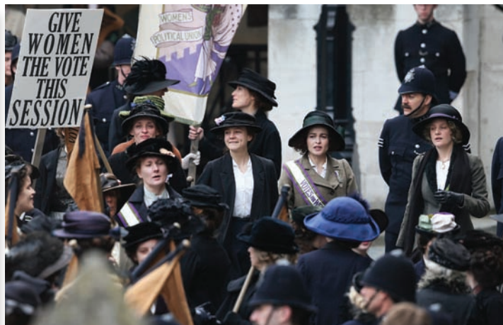
Кадр из картины «Суфражистка»