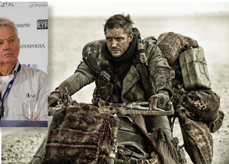
Том Харди в роли Безумного Макса

которым его давно связывают работа и дружба. Далее, для Джона Сила, несмотря на его солидный возраст, это была первая картина, снятая цифровыми камерами, и первый же опыт съемки в 3D.