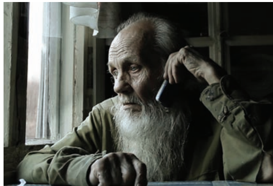
Кадр из фильма «Разговор»

Ну а «Золотую жабу» в этой номинации присудили фильму «Сказка о любви, безумии и смерти» (A tale of love, madness and death) – оператор Альваро Ангита (Alvaro Anguita), режиссер Михаэль Бустос (Mijael Bustos). Производство – Чили и Германия.