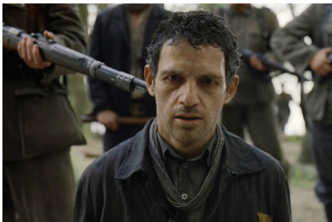
Кадр из картины «Сын Шаула»

Экспозиция Panavision располагала парой пленочных кинокамер, которые по-прежнему используются для съемки некоторых голливудских (и не только) кинофильмов. Камеры были