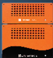
XStream Field 2