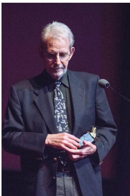
Монтажер Уолтер Мерч