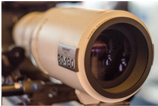
Анаморфотный вариообъектив Hawk 80...180 мм

снабжены специальными объективами, позволяющими получать те или иные оптические эффекты. Здесь же располагались и стандартные сферические и анаморфотные объективы Panavision, светодиодные приборы Panalux, фильтры и другие полезные «мелочи».