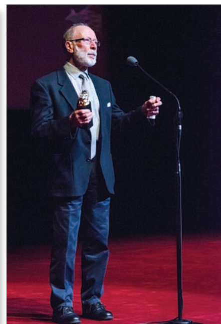
Кинооператор Крис Менгес