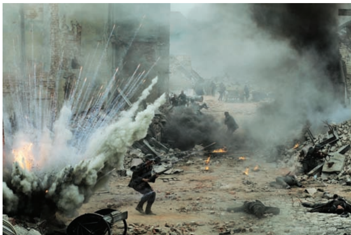
Сцена боя из картины «Варшава 44»

Возвращаясь к документальному кино, хочется отметить, что оно, как уже отмечалось выше, перешло на новый уровень качества. Это произошло благодаря тому, что документалистам стало доступно оборудование, обеспечивающее высокое качество изображения и звука при цене, которая по карману даже одиночкам, не говоря уже о малых и средних студиях. А ведь еще лет пять назад в конкурсе документального кино попадались ленты, снятые, страшно сказать, в формате DVCAM, то есть в стандартном разрешении!