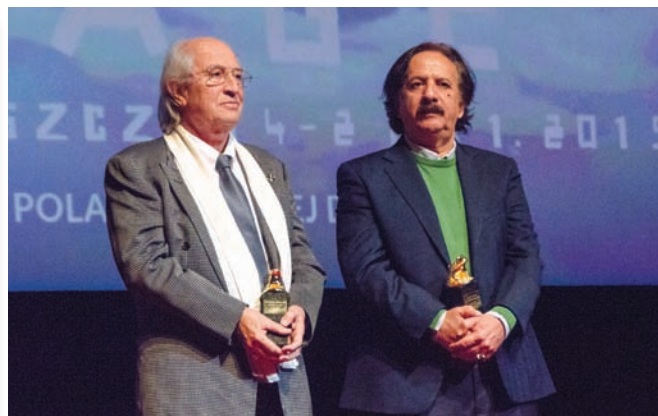
Витторио Стораро (слева) и Меджид Меджиди