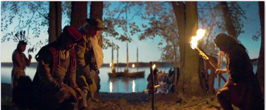
Кадр из фильма «Хочелага, земля душ»