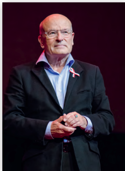
Волкер Шлендорф – кинооператор, обладатель награды Oscar и вдохновитель Camerimage