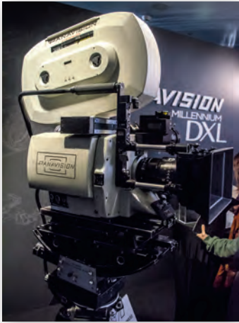
Камера Panavision Super 70, использовавшаяся на съемках фильма