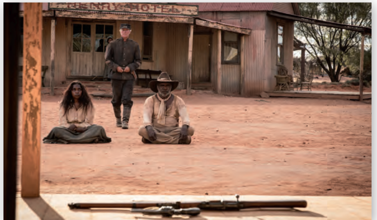
Кадр из картины «Это жизнь»