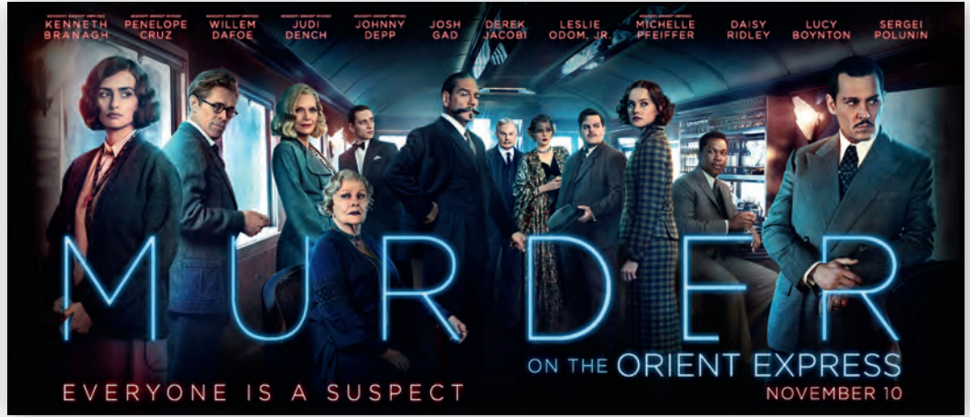
Постер фильма «Убийство в Восточном экспрессе»

Далее на сцену был приглашен американский документалист Фредерик Вайзман (Frederick Wiseman), удостоенный награды «За выдающиеся достижения в документальном кинематографе». Он отметил, что в течение всей своей профессиональной деятельности отдавал должное первой поправке Конституции США, гарантирующей свободу слова. Трудно представить, что создатели Конституции думали именно о документальном кино, когда прописывали эту поправку, но она стала залогом того, что граждане США, да и не только, получили возможность видеть на экране жизнь во всех ее проявлениях, пусть даже не