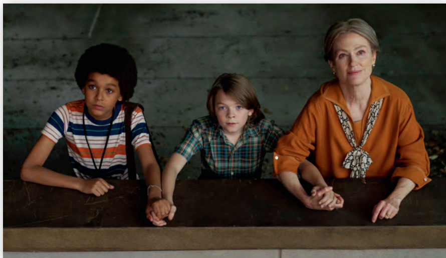
Финальная сцена фильма «Мир, полный чудес»