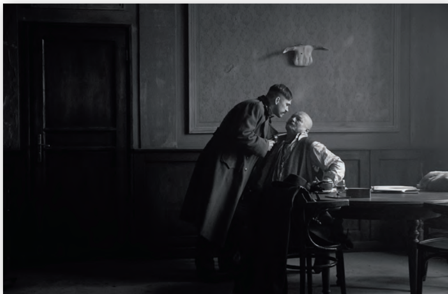
Кадр из картины «Мясник, шлюха и одноглазый»

Итак, фильм «Мир, полный чудес» (Wonderstruck) произвел довольно необычное впечатление. Во время просмотра показалось, что он излишне затянут, а в некоторых местах просто нуден. Но вот какое дело – даже после выхода из кинозала картина, что называется, не отпускала. А спустя полчаса пришло понимание, что фильм просто великолепен! Это касается и режиссуры, и игры актеров, при том, что главные роли играют дети, и, разумеется, работы оператора.