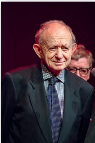
Документалист Фредерик Вайзман

всегда радующих глаз. А далее мэтр документалистики с горечью отметил, что далеко не все сегодня в Америке разделяют закрепленный в Конституции подход. Тут очень хочется добавить – увы, не только в Америке.