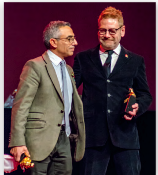
Харис Замбарлукас (слева) и Кеннет Бранаг