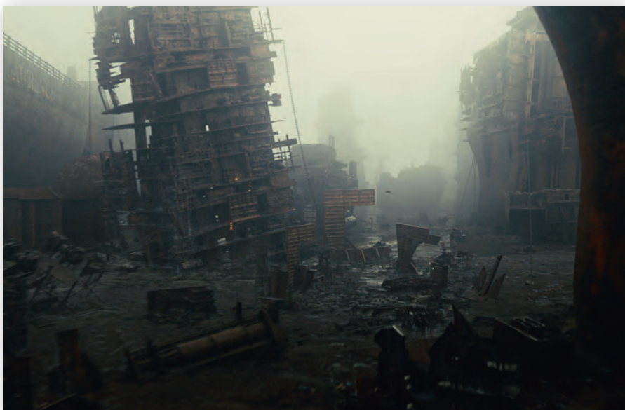
Компьютерная модель мусорной свалки и кадр из фильма