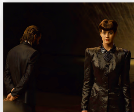
Работа над цифровым образом героини: актриса на площадке, компьютерная модель головы и кадр из фильма