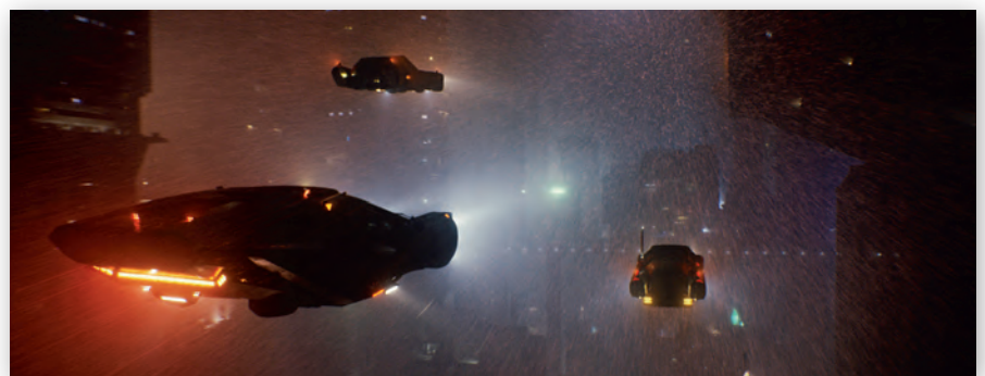
Компьютерная модель города и спиннеров и кадр из фильма

Вначале главный герой по имени Кей летит на ферму Сэппера Мортон в машине, которую фанаты первого фильма назвали спиннером.