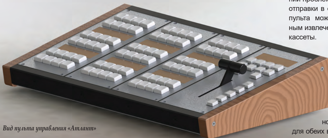
Вид пульта управления «Атлант»

для обеих версий созданы видеоролики, иллюстрирующие сборку и монтаж.