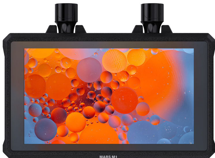
Hollyland Mars M1 Enhanced

В качестве приемников сигнала с монитора также можно использовать видеопередатчики Hollyland, такие как Mars 400S/300 Pro, Mars 4K или Cosmo C1.