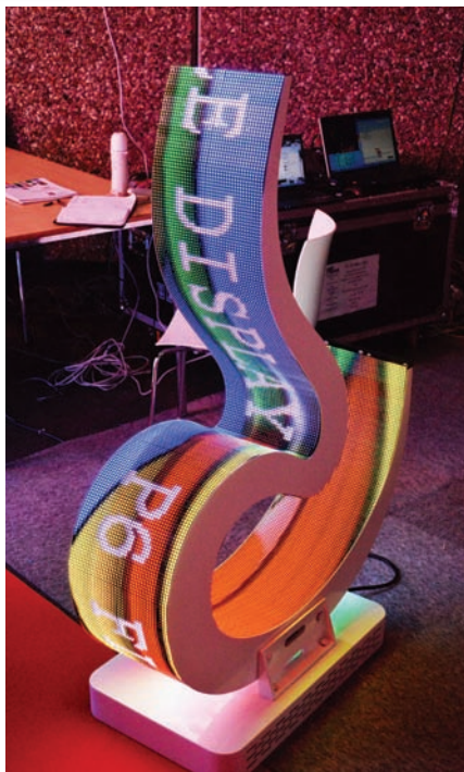
Светодиодное табло криволинейной формы

Panasonic представила новый яркий одноматричный DLP-проектор DZ780, предназначенный для лекционных и выставочных залов, музеев, сценических площадок и прокатного бизнеса. Проектор снабжен герметичной оптической системой и двумя ламповыми блоками, срок службы которых достигает 3000 ч. Максимальный световой поток, формируемый проектором, составляет 7000 лм. Система жидкостного охлаждения уменьшает рабочий шум до 30 дБ (при работе ламп на полную мощность), а интерфейс Digital Link позволяет передавать некомпьютеризированный цифровой видеосигнал и сигналы управления по обычной витой паре на расстояние до 100 м.