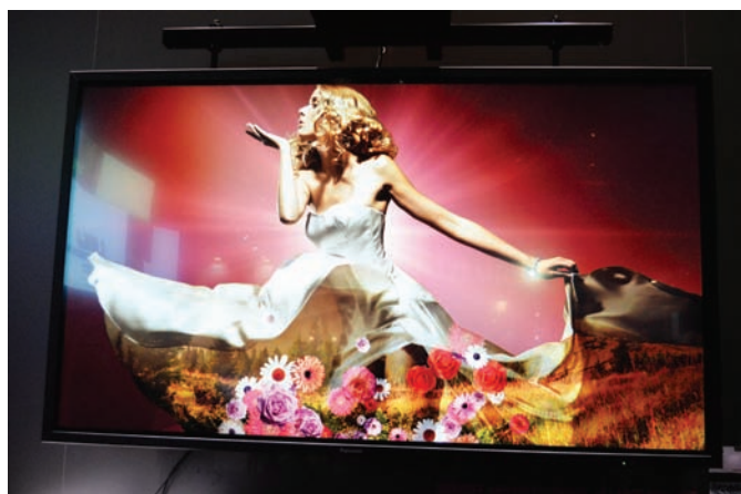
ЖК-дисплей Panasonic TH-84LQ70W

Кстати, о видеостенах. Они продолжают совершенствоваться, хотя есть подозрение, что «недолго музыке играть» – на пятки на-