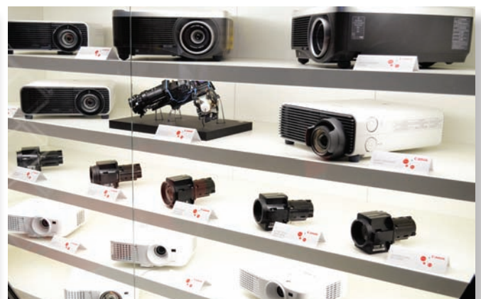
Видеопроекторы Canon и оптика для них