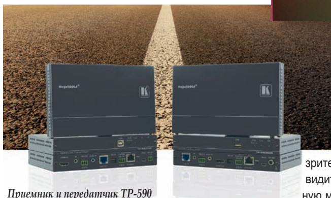
Приемник и передатчик TP-590

А в категории оборудования для передачи сигнала по витой паре были представлены удлинители TP-590RXR (приемник) и TP-590TXR (передатчик), отвечающие требованиям HDBaseT 2.0, причем компания Kramer Electronics стала одной из первых, применивших в своих приборах новые чип-сеты Colligo производства Valens.