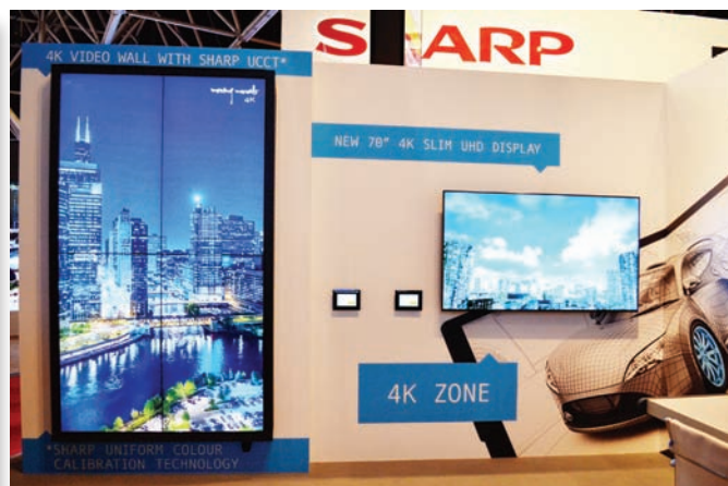
Часть стенда Sharp, посвященная новым дисплеям