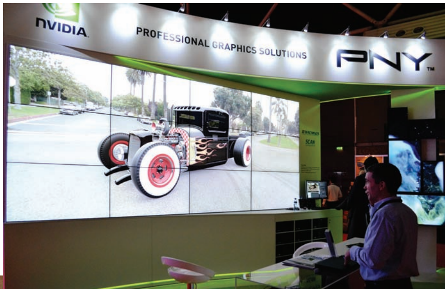
Изображение на видеостене, визуализированное с помощью графических процессоров NVidia

Еще одной задачей, возникающей при отображении медиаконтента, когда речь идет о совмещении изображений от нескольких источников в единую картинку,