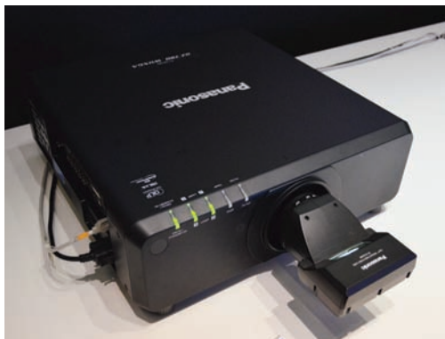
Видеопроектор Panasonic DZ780

Лазерные проекторы демонстрировались на стенде Sony. В том числе модель VPL-FHZ65, дающая световой поток 6000 лм. Это совсем новая модель, подробной информации о которой пока нет даже на официальном сайте компании. Известно только, что проектор является трехматричным, изображение формируется ЖК-матрицами, а источником света является лазер. Кроме того, проектор экономичен, может работать без обслуживания до 20 тыс. ч, а само обслуживание не представляет сложности.