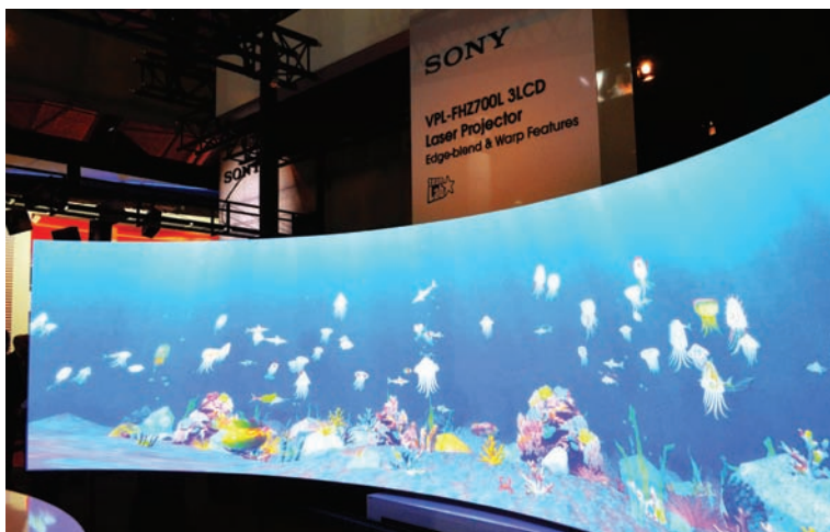
Изогнутое панорамное изображение, сформированное тремя проекторами VPL-FHZ700L

К первым относится 8-входовый сдвоенный 4K-масштабатор VP-772, обеспечивающий к тому же точную коммутацию видео и выполнение спецэффектов. Прибор предназначен для применения во время различных сценических шоу, в аудиториях, конференц-залах и студиях производства контента, а именно, для подачи на видеопроекторы и дисплеи соответствующего изображения. VP-772 обрабатывает поступающие на входы сигналы видео и звука, а