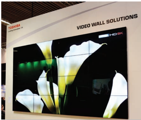
Видеостена общим разрешением 8K, составленная из ЖК-дисплеев Toshiba

ступают светодиодные экраны. Но пока еще качество изображения на видеостенах, составленных из ЖК-дисплеев, выше, чем на самых лучших светодиодных экранах, даже несмотря на стыки. К тому же они становятся все тоньше, а потому незаметнее. Хотя есть физический предел, обусловленный механическими особенностями конструкции. И даже так называемые безрамочные дисплеи все равно дают видимый стык, поскольку рамка на самом деле есть, но она замаскирована стеклом экрана.