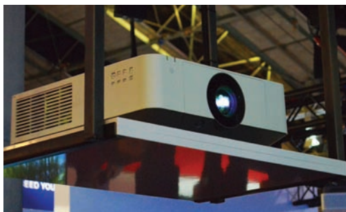
Лазерный видеопроектор Sony VPL-FHZ65

Здесь же, на стенде, была организована демонстрация панорамного изображения в нескольких вариантах. На большой