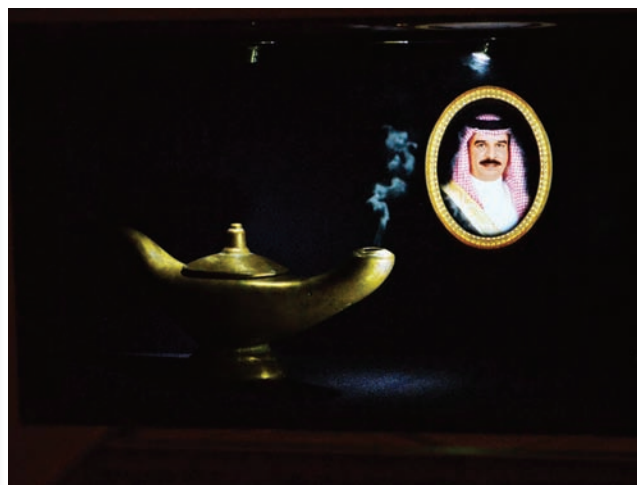
Демонстрация голографических возможностей. Лампа – реальна, а портрет – голограмма