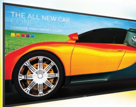
Q-дисплей Philips серии Q на базе технологии Ambilight

Есть и еще одна новая линейка дисплеев Philips, расширяющая спектр продуктов компании. Это дисплеи серии U, обладающие разрешением Ultra HD. В частности, самый большой на сегодня в Philips дисплей для ВИС BDL9870EU с экраном 98" (250 см) по диагонали. Он рассчитан