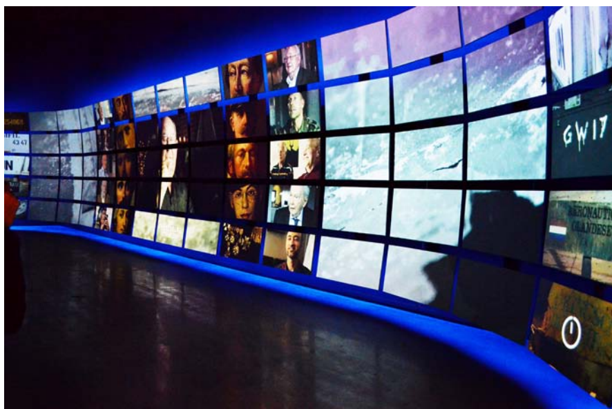
Панорамное изображение, сформированное с помощью системы Dataton

Довольно существенную роль играют устройства крепления оборудования и его защиты от внешнего воздействия. С системной аппаратурой все проще – она, как правило, располагается вне доступа аудитории. С дисплеями, экранами и видеопроекторами сложнее – их нужно защитить не только от влаги,