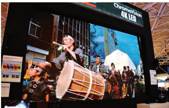
Светодиодный 4K-экран компании ChromaVision – ячеистая структура незаметна

Своим чередом идет развитие видеопроекторов. Все чаще появляются модели с лазерным источником света. У видеопроекторов свои достоинства – они позволяют формировать очень большие по пло-