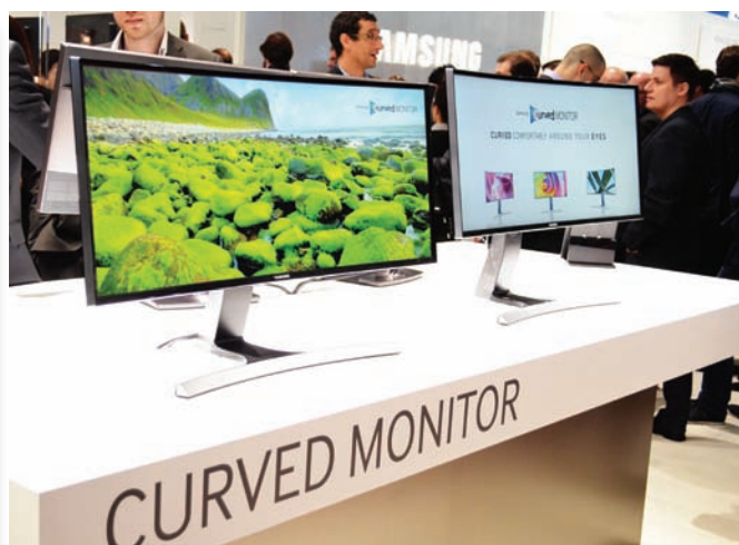
Изогнутые дисплеи Samsung