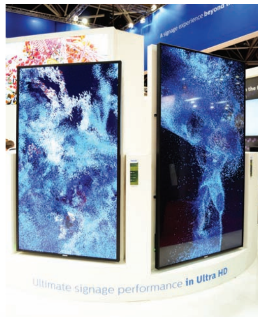
UHD-дисплеи Philips серии U

на круглосуточную работу и может быть установлен как горизонтально, так и вертикально. До этого в серии U был разработан 84" дисплей BDL8470EU. Он поступит в продажу в первой половине нынешнего года, а 98" модель – во втором полугодии. Обе модели снабжены матрицами типа IPS, обеспечивают точную цветопередачу, формируют четкое и яркое изображение, а угол обзора экрана у них составляет ±178°. Яркость дисплеев – 500 кд/м 2 , кон-