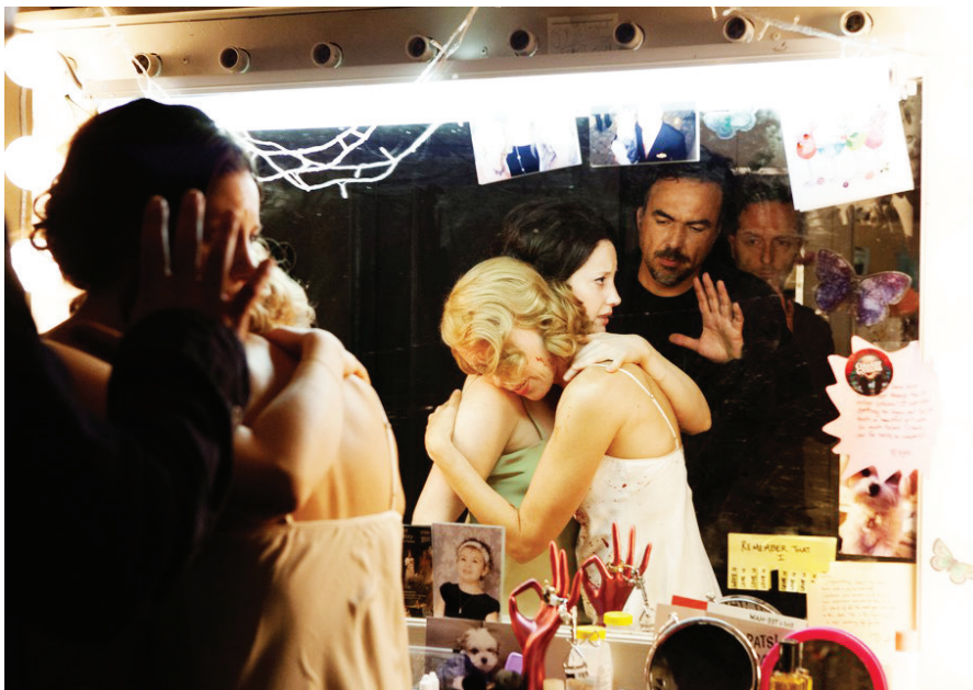
Иньярриту дает установку актрисам

есть к моменту начала основных съемок у режиссера картины на руках был жесткий диск с черновой версией всех театральных сцен. Любецки и Иньярриту успели определиться с ракурсами и ритмом, а также с переходами, которые бы скрывали монтажные склейки. Режиссер хотел снять картину так, чтобы у зрителя возникло ощущение непрерывного движения, которое бы не нарушалось склейками. Забегая