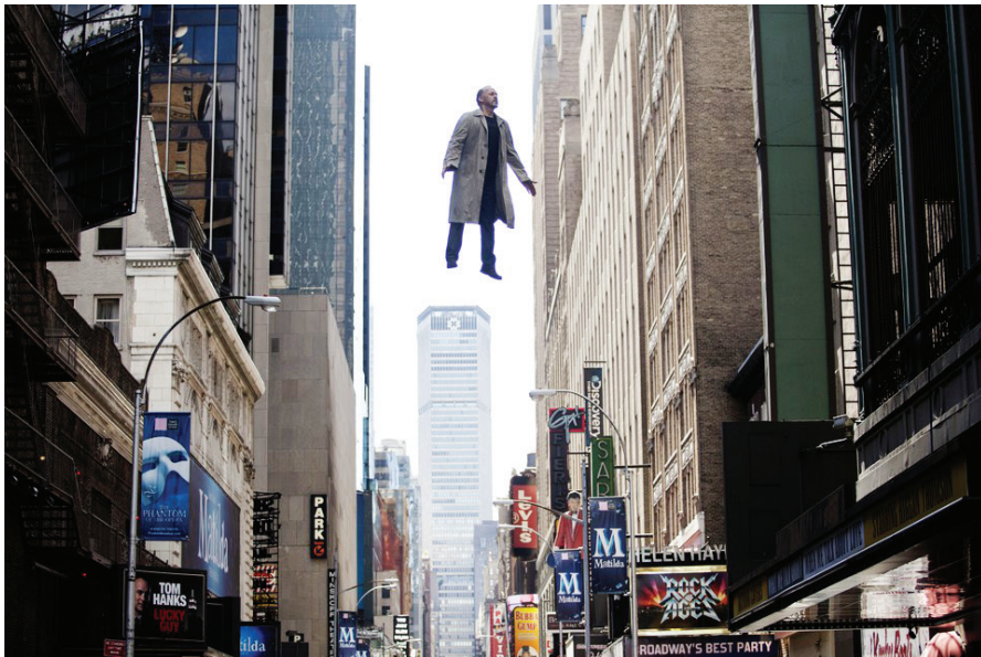
Кадр из фильма «Бердмэн»

О театре снято ничуть не меньше фильмов, чем о телевидении или закулисье кинематографа, но картина «Бердмэн» Алехандро Гонсалеса Иньярриту всегда будет стоять особняком и выделяться совершенной формой и безупречным содержанием. Это яркий фильм о противоречивости человеческой природы, надеждах и страхах людей творческих профессий стал одним из наиболее значимых кинособытий ушедшего года. Кинокритики и журналисты рукоплескали фильму на Венецианском кинофестивале, а кино-