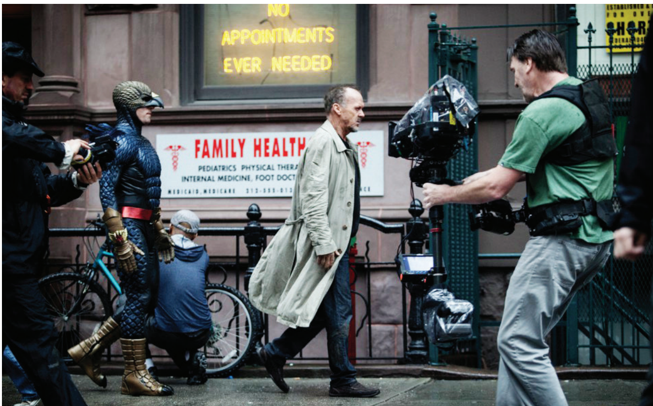
Фильм снимался на цифровые камеры Arri Alexa

«Когда герой Китона идет по коридорам театра, мы сначала освещаем его двумя флуоресцентными лампами, затем зеленоватым светом, а затем лампой дневного света, в результате изображение постепенно становится