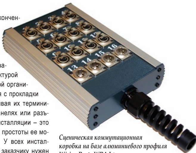
Сценическая коммутационная коробка на базе алюминиевого профиля Wiring Parts WPA L+

Это конструктивно законченные блоки для высококачественных кабельных инсталляций аудиовизуальных систем и комплексов. Объединение оборудования кабельной инфраструктурой всегда требует продуманной организации всех стадий, начиная с прокладки кабельных трасс и заканчивая их терминированием на оконечных панелях или разъемах. Высокое качество инсталляции – это залог надежности системы, простоты ее модернизации и обслуживания. У всех инсталляций есть нечто общее – заказчику нужен отличный результат в максимально сжатые сроки. Одни из способов достижения этого – использование блоков 4 Installations, в основу разработки которых лег многолетний опыт инсталляции объектов, сделанных по совершенно непохожим друг на друга проектам многих инженеров-проектировщиков в самых разных условиях и в самые разные сроки. В чем же состоят особенности блоков серии 4 Installations, и почему им отдают предпочтение многие проектировщики и инсталляторы? Они максимально унифицированы, не требуют «додумывания» в процессе инсталляции, просты, логичны, надежны, прочны, позволяют монтажнику интуитивно