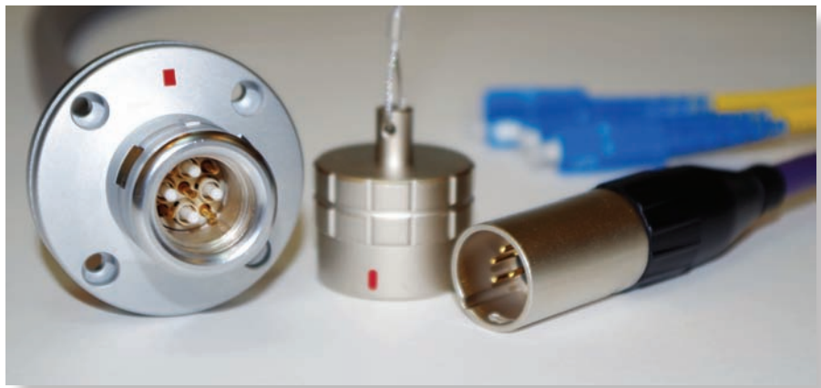
Разделанная на разъемы кабельная сборка Wiring Parts FXG.4K.95D. Bio Set

Более подробно узнать о продукции и стратегии Wiring Parts можно на сайте: www.wiringparts.ru .