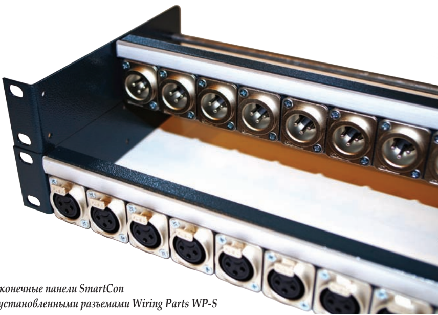
Оконечные панели SmartCon с установленными разъемами Wiring Parts WP-S

бильных систем, ПТС, а также комплексов, до предела насыщенным оборудованием. Установочные размеры панелей соответствуют стандарту «Системы несущих конструкций серии 482,6 мм» ГОСТ 28601.1-90 (СТ СЭВ 834-89).