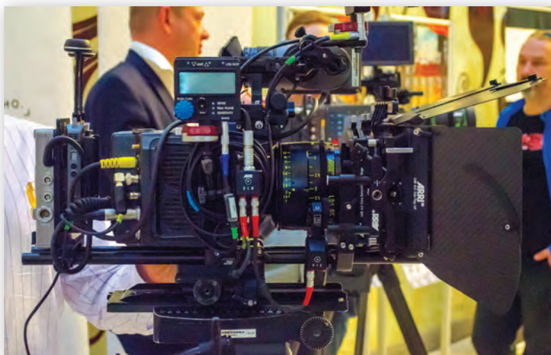
Камера ALEXA Mini на стенде ARRI

Торжество завершилось, а работа продолжается. Идут съемки новых фильмов, многие из которых будут номинированы на следующий «Белый квадрат». Имя лауреата узнаем через год.