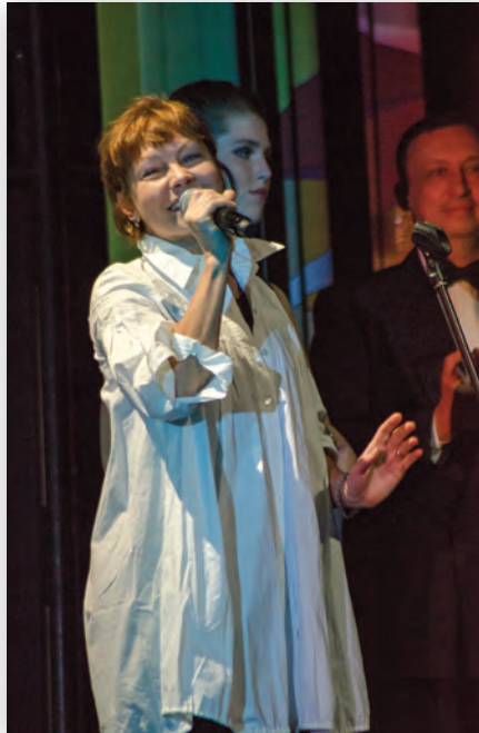
Актриса Алена Бабенко