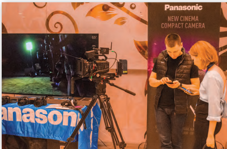
Стенд Panasonic с цифровой кинокамерой EVA 1 и другими моделями