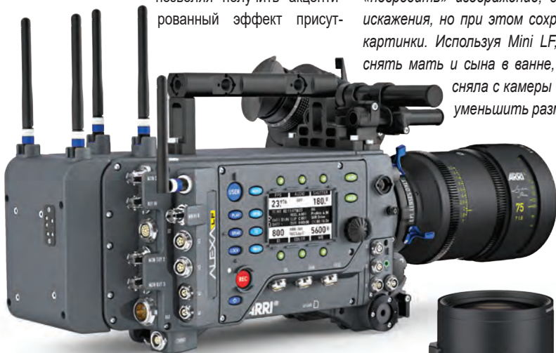
Камера ALEXA LF

находилась в 20 см от героев, но имела возможность реагировать на их движения. Этого нельзя было бы сделать, снимая на более крупную камеру. Mini LF привносит в изображение интимность, неповторимую близость. Это некая спонтанность образа, наиболее близкая к моему визуальному восприятию. Изображение получается гораздо более живым. Сегодня я не представляю себе работы без Mini LF. При малейшей возможности я выберу для съемки именно ее».