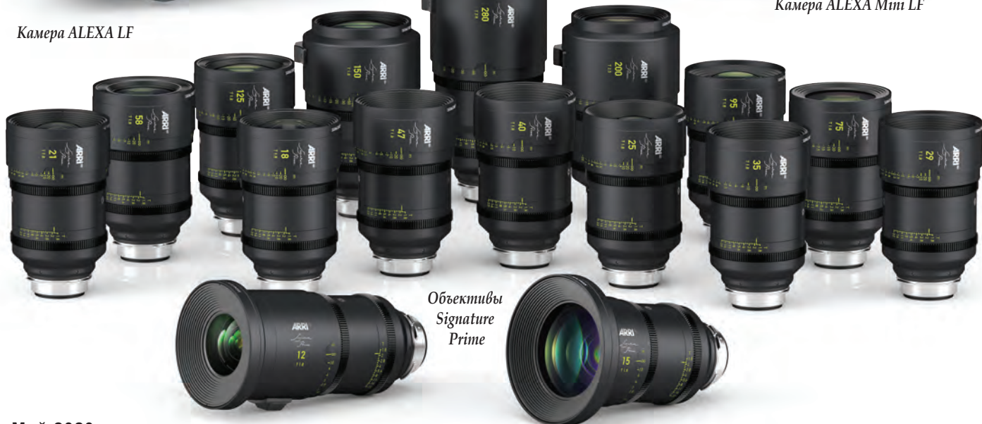
Объективы Signature Prime