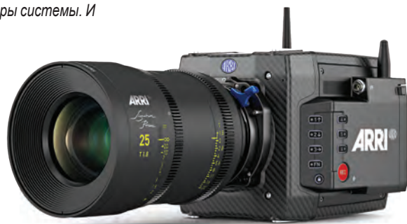
Камера ALEXA Mini LF