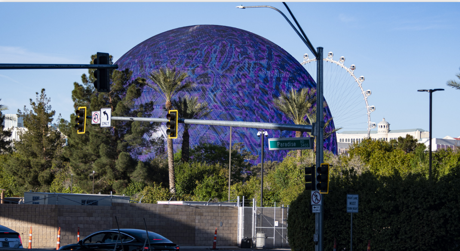
The Sphere – грандиозное по размерам и концентрации технологий сооружение в Лас-Вегасе

Решение было найдено, но сначала немного предыстории. «Сфера» в Лас-Вегасе попала во все информационные заголовки после того, как состоялось ее открытие, ознаменовавшееся концертом обосновавшейся там на некоторое время группы U2. Концерты сопровождаются великолепной проекцией и световыми эффектами, которые создал дизайнер группы Вилли Вильямс. Визуально и новый концерт, и само сооружение просто потрясают воображение. Хотя «Сфера» гораздо больше по размерам и технологически совершеннее, есть и другие здания примерно такой же конструкции, где проводятся различные развлекательные мероприятия. Например, Avicii Arena (Globen) в Стокгольме (Швеция) и Al Wasl Plaza в Дубае (ОАЭ). Именно они стали своего рода первопроходцами.