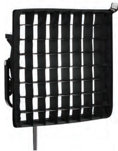
Аксессуары DoPchoice для Gemini 1x1 Soft (слева направо): рамка Rabbit-Ears Mini, софтбокс и решетка

Set. В его состав входят диффузоры с различными свойствами, устанавливаемые на фронтальную часть софтбокса вместо штатного диффузора. В частности, это диффузоры плотностью 1/4 и 1/2 от штатного, а также диффузор Magic Cloth.