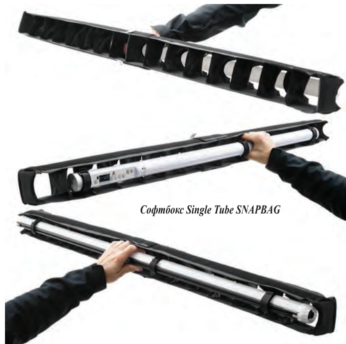
Софтбокс Single Tube SNAPBAG