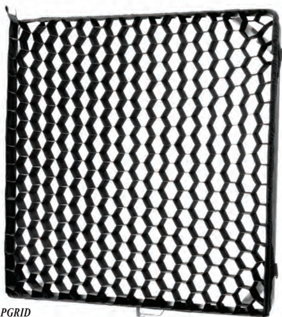
Решетка SNAPGRID HONEYCOMB размером 4'x4'

А для случаев, когда требуется варьировать рассеяние и контрастность, предусмотрен комплект SNAPBAG Diffusion Cloth