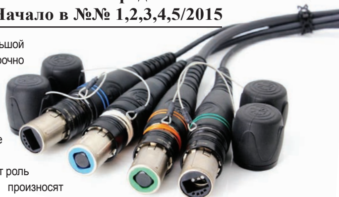
Оптические разъемы Neutrik

Работа, связанная с монтажом оптических разъемов, требует совершенно иных навыков, чем те, что связаны с использованием классического паяльника. Технология и материалы тоже другие – теперь это эпоксидные клеи, изопропиловый спирт, специ-