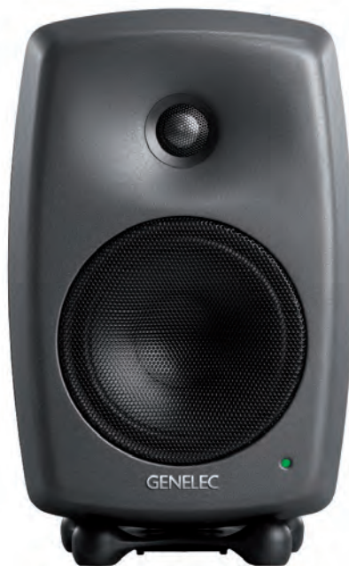
Активный IP-аудиомонитор 8430A

Низкочастотная составляющая излучается снизу монитора через волновод DCW (Directivity Controlled Waveguide), поэтому собственно сабвуфер не виден. 8351 обеспечивает звуковое давление в 110 дБ на расстоянии 1 м, благодаря чему оптимален как монитор ближнего поля. Он снабжен тремя усилителями мощности: 150-ваттным