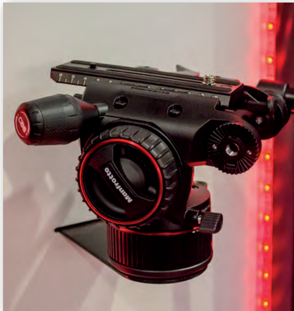
Панорамная головка Nitrotech N8

А новая система StorNext 6, созданная в развитие одноименной платформы, получила расширенные функции управления данными, основанные на автоматизации и наборах правил. Функционал системы позволяет работать с медиаданными быстро, эффективно, в соответствии с требованиями конкретного проекта, а также обеспечивает совместный доступ к данным для географически удаленных друг от друга рабочих групп. Предусмотрены возможности управления контентом и его безопасного хранения.