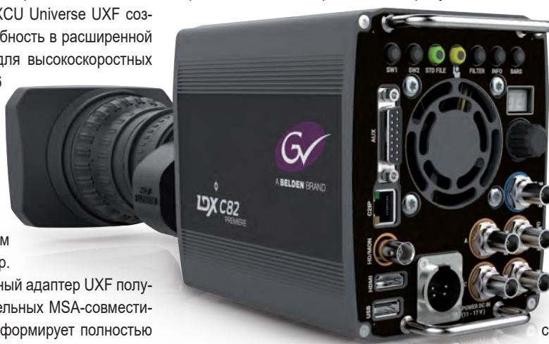
Камера LDX 82C – компактная версия

Помимо синхронизированных по времени данных, GY-HM660SC позволяет вводить специфическую описательную информацию, относящуюся к типу игры (нападение, защита, штрафной удар и др.), для чего есть интуитивно понятный GUI, устанавливаемый на мобильные устройства. Платформа XOS Thunder способна затем автоматически систематизировать и подразделять моменты игры, располагая их в соответствующих папках, что позволяет сэкономить часы, затрачиваемые на черновую нарезку и маркировку, как это делалось ранее.