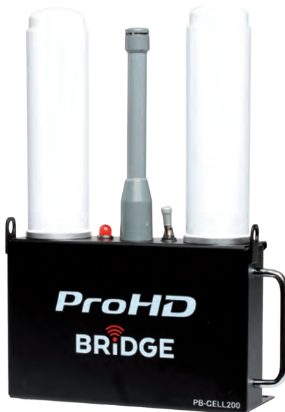
PB-CELL200 ProHD Portable Bridge

Если подробнее, версия 4.0 обеспечивает 4K-запись 4:2:2 (8 бит) в форматах 24/25/30p на карты памяти SDXC. Кроме того, появив-