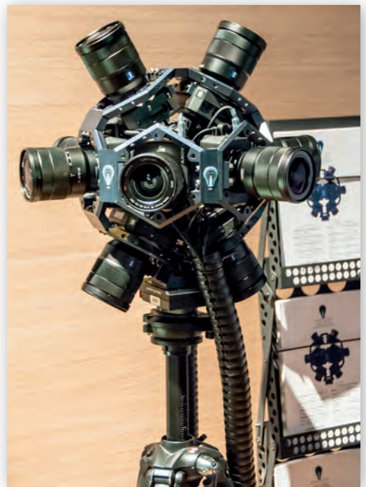
Система сферической съемки, построенная на базе камер UMC-S3CA

Новое устройство AXS-AR1 предназначено для чтения/записи носителей AXS и SxS, оснащено интерфейсом Thunderbolt 2 и поддерживает одновременную запись в разных форматах, например, RAW (X-OCN) и XAVC (или MPEG50), которыми оперируют камеры F55/F5 и AXS-R7.