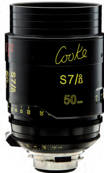
50-мм объектив серии S7/i Full Frame Plus

Ну а что касается продукции, то это линейка объективов S7/i Full Frame Plus. Это объективы с фиксированным фокусным расстоянием, рассчитанные на полнокадровые сенсоры цифровых кинокамер, обеспечивающие круг изображения диаметром 46,31 мм. Такие сенсоры, к примеру, используются в камерах RED Weapon 8K.