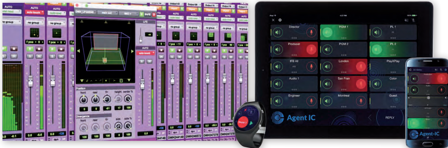
Интерфейс Pro Tools – работа в формате Dolby Atmos

◆ LQ-4WG2 – два 4-проводных интерфейса + GPIO, портативное устройство;