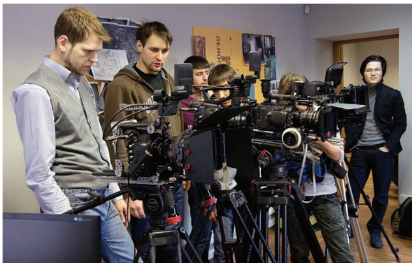
Сравнительное тестирование кинооптики на киностудии «Навигатор»

На первом же тестировании в Канаде, в присутствии десятка специалистов и операторов из разных стран, светосила ILLUMINA сравнивалась одновременно на трех цифровых камерах со светосилой аналогичных объективов известных мировых производителей. Максимальную светосилу при качественном изображении показали российские объективы. Это произвело сильное впечатление на собравшихся, что послужило хорошим аргументом для ЛОМО запустить объективы в серию. Ни опытных мастеров, ни