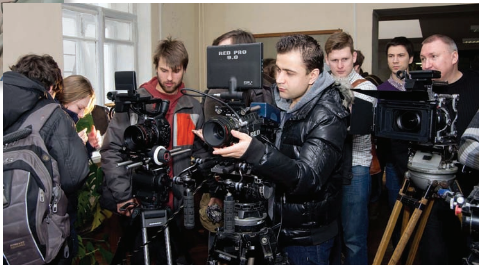
Сравнительное тестирование кинооптики на «Ленфильме»

На киностудии «Ленфильм» были проведены сравнительные тесты шести линеек объективов ведущих производителей, где в качестве экспертов участвовали профессиональные кинооператоры