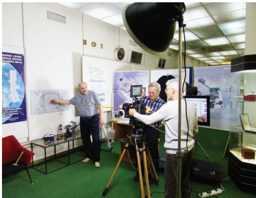
Комплекс визуального контроля на ЛОМО

ниях диафрагмы, особенно на 18-мм объективе, появляется краевая хроматическая аберрация, снижающая резкость кадра. Поэтому снимать натуру при полностью открытой диафрагме – нонсенс, так как общие планы содержат большое количество мелких деталей, а света при этом в избытке. Его даже приходится гасить нейтральными светофильтрами, которые качество изображения явно не улучшают. Использовать высокую светосилу объективов лучше в условиях недостаточного освещения, когда мягкость изображения по краям помогает выделить в кадре самую главную, центральную его часть и очень выразительно отделить передний план от фона. Уход от открытой диафрагмы делает картинку очень резкой, ничем не уступающей по качеству той, что формируется зарубежными аналогами. Самый свежий 14-мм объектив, на мой взгляд, можно вообще считать лучшим в своем классе.