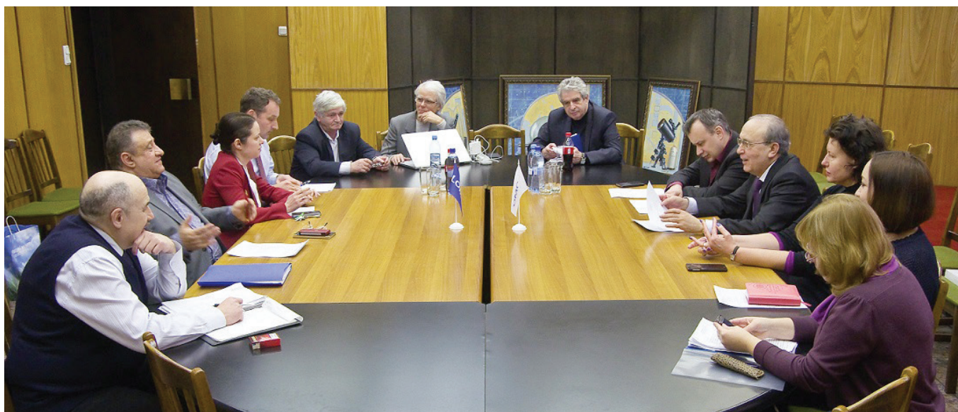
Переговоры ЛОМО и Luma Tech

Знакомство в 2010 году с новой линейкой из пяти объективов (18, 25, 35, 50 и 80 мм) произвело на нас с братом сильное впечатление. Кроме солидного внешнего вида, почти все объективы показали решающую способность в центре свыше 140 лин/мм. И это при превосходной светосиле T1,3. Вспоминая лекции по оптике во ВГИКе, я четко понимал, что разрешение более 100 линий говорит о высоком качестве оптики, которую можно считать важнейшим инструментом каждого оператора. Когда начались испытания при диафрагме T2, я отчетливо различал штрихи