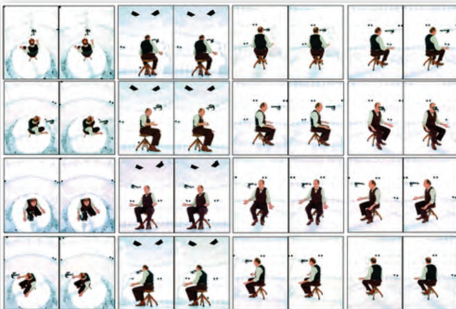
Рис. 3. 32 камерных ракурса