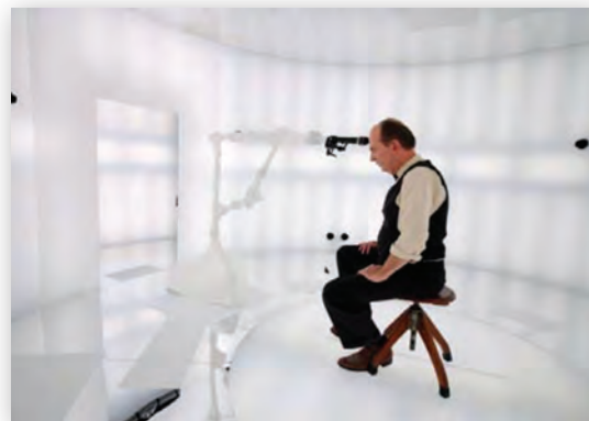
Рис. 2. Студия изнутри во время первой тестовой трансляции