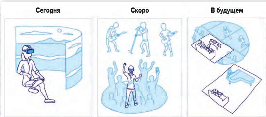
Рис. 1. Эволюция потребления сервисов VR и AR