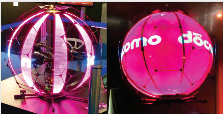
Рис. 5. Формирование сферического изображения с помощью «видеострун»

Сфера, на самом деле, формировалась из небольшого числа гибких струн, каждая из которых сверху и снизу крепилась к шарнирам на оси, соединенной с дроном. Индивидуально адресуемые светодиодные пиксели вдоль каждой из струн формируют основу многоцветного цветного дисплея, который можно просматривать с любого ракурса по горизонтали и вертикали. Благодаря природе человеческого зрения создается иллюзия целостного сферического изображения, создаваемого с помощью вращающихся LED-струн. Сами дроны, несущие такие «видеоструны», могли бы иметь интересный потенциал для сценических представлений, если таковое еще не делается.