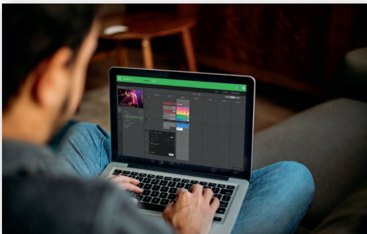
Использовать TVU Channel можно в любом месте, где есть подключение к сети